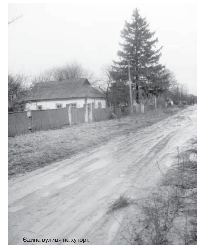
Єдина вулиця на хуторі.

Горе прийшло у кожний двір, як почалася війна, у кожну родину: там батько на полі бою загинув, там син... Близько 70 чоловік не повернулися додому. Зовсім мало їх залишилося на хуторі. Розповідають старожили, що жив у селі чоловік, який допомагав партизанам. Як дізналися про це поліція, хотіли всю його родину розстріляти. Та він чудом врятував свою дружину і двох діток, сховавшись у льосі в сусідів. Проте не оминула його ворожа