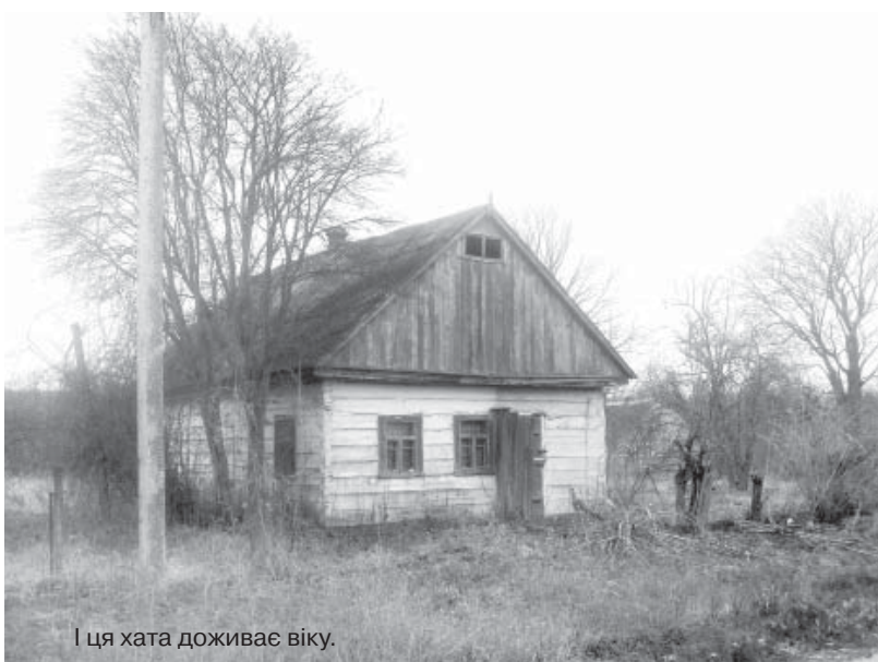
І ця хата доживає віку.

холодець варила, ковбаски пекла та пірижки ліпила. Збиралася в хаті вся родина святкувати, а потім до сусідів ходили, гуляли всім селом. Навіть ряжені були,