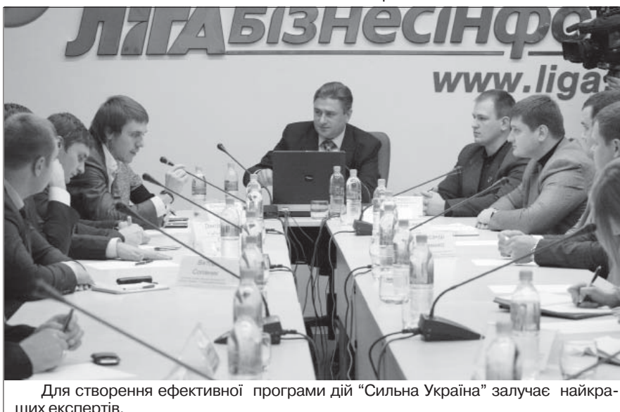
Для створення ефективної програми дій «Сильна Україна» залучає найкращих експертів.

Прес служба Київської обласної організації політичної партії «Сильна Україна».