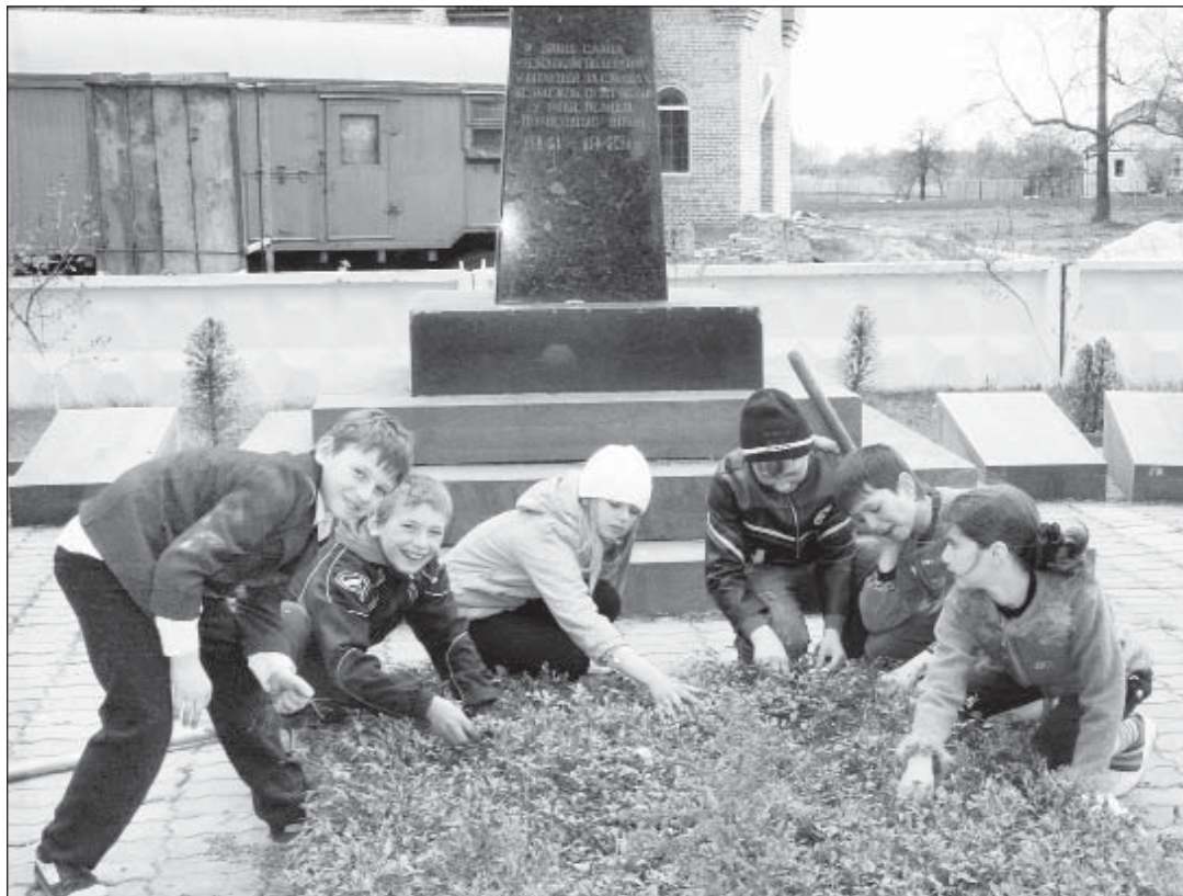
Благоустроюють сквер біля пам'ятника односельцям, загиблим у роки Великої Вітчизняної війни, учні Мотижинського ліцею.