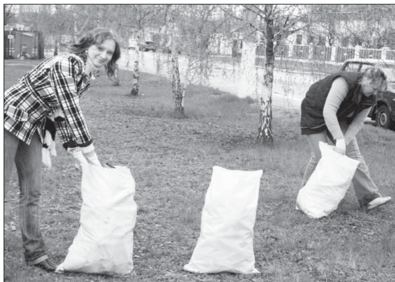
Наводять чистоту на центральній вулиці Макарова працівники райдержадміністрації і районної ради

Організовано вийшли на всеукраїнський суботник і понад 6 тисяч жителів району. Цього дня ліквідовано 11 стихійних сміттєзвалищ, очищено від сміття 78 кілометрів узбіч автомобільних доріг і 48 тисяч квадратних метрів водойм, висаджено 1512 дерев та кущів, побілено 15 кілометрів бордюру, створено 1540 квадратних метрів квітників.