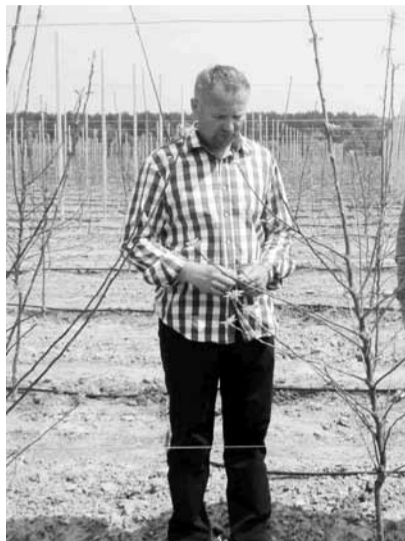
ТОВ «АФ «Весна-2011»

ней збільшилося на 296 голів й становить 1340. Племінного поголів'я овець утримується 462 голови, що на 14 більше. Чисельність коней в сільськогосподарських підприємствах зменшилася на 6 голів й складає 72 голови. Птиці всіх видів утримується 251777 голів, середнє поголів'я курей-несучок становить 168202.