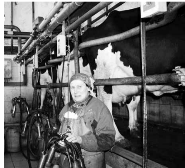
ТОВ «Агрофірма «Київська»

Валовий надій молока склав 7819,8 тонн, що на 118 тонн більше, ніж на початку 2012 року. На корову надано 4722 кг молока, що на 326 кг більше. Одержано 53854 тис. штук яєць. М'яса (в живій вазі) реалізовано 459,9 тонн, що на 381 тонн