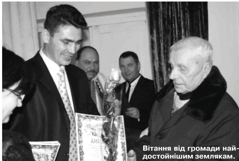
Вітання від громади найдостойнішим землякам.

доблесної слави, яка відтепер зберігатиметься в сільській раді.