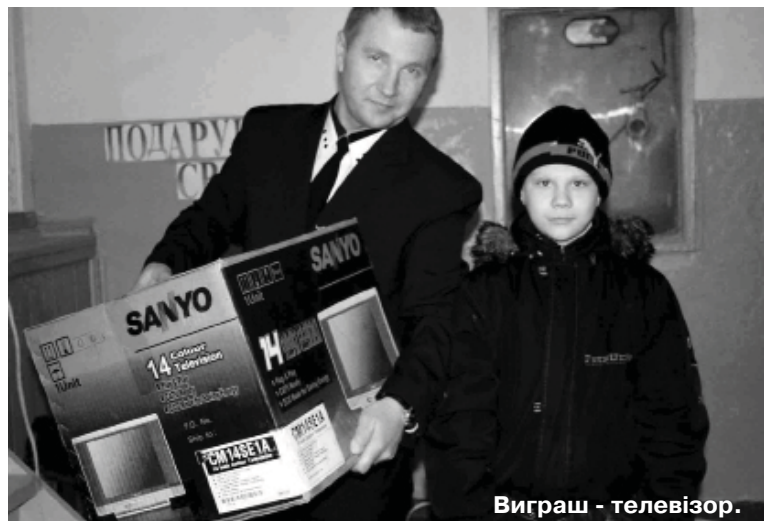
Виграш - телевизор.

початковано турнір на кубок Івана Бондаренка.